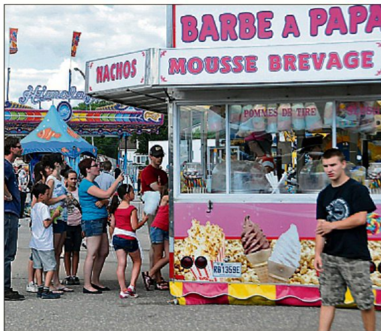
La barbe à papa est toujours populaire autant chez les petits que chez les grands.