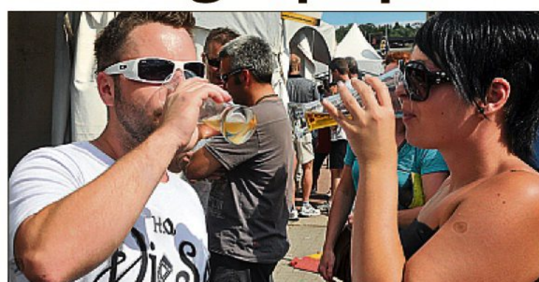
Le premier Festival des bières du monde a connu un beau succès.

La quatrième édition devrait se dérouler sur la zone portuaire l'an prochain. Une soixantaine d'exposants, dont 40 brasseurs, étaient sur place pour faire goûter différents produits aux festivaliers. Les spectacles, dont ceux d'Éric Lapointe et Led Zeppé, ont été couronnés de succès. □