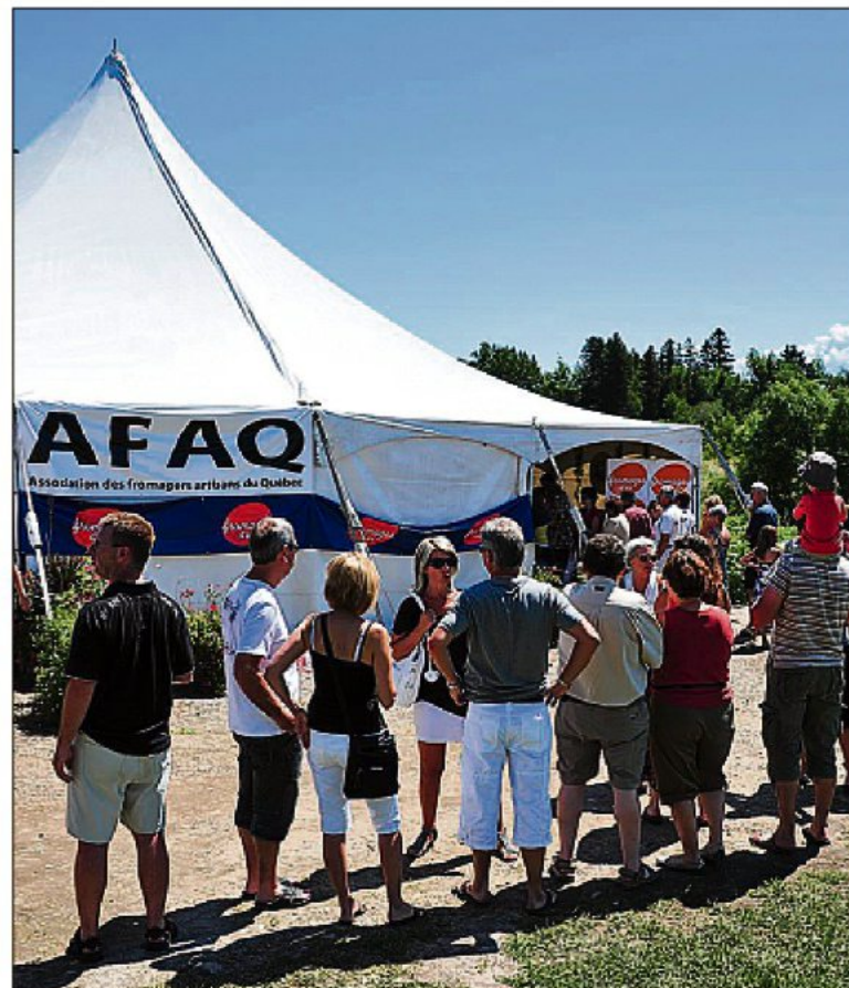
Les gens devaient faire la file pour entrer dans la tente de dégustation.