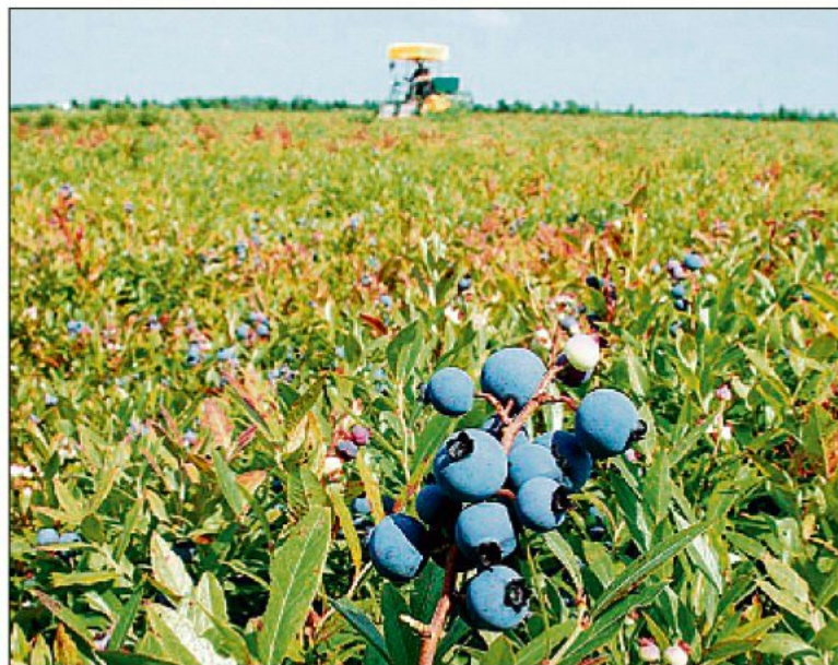
La cueillette des bleuets devrait commencer autour du 8 août.